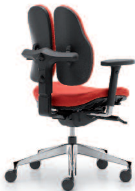
duo back® 11 | Rückenkappe in Kunststoff schwarz