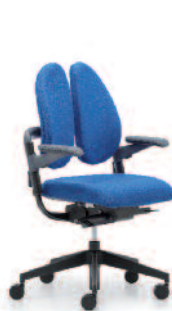
xenium-basic duo back®

Nach jedem Geschmack Wir haben das duo back® Prinzip auch in anderen Stuhlfamilien zum Einsatz gebracht.