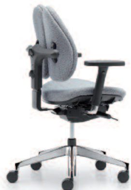
duo back® 12 | Vollpolsterrücken