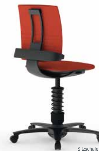
Sitzschale schwarz, Bezug Trevira coral