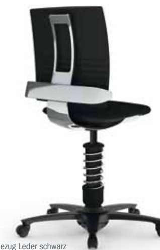
Sitzschale Alu poliert, Bezug Leder schwarz