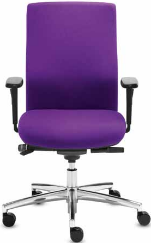
DM SM 95980 automatic + Armlehnen/Armrests 171

Drehstuhl mit mittelhoher, höhenverstellbarer Vollpolster-Rückenlehne (51 cm) , wechselbarem Komfortsitz und Daumatic®-Mechanik für eine automatische Körpergewichtsanzpassung.