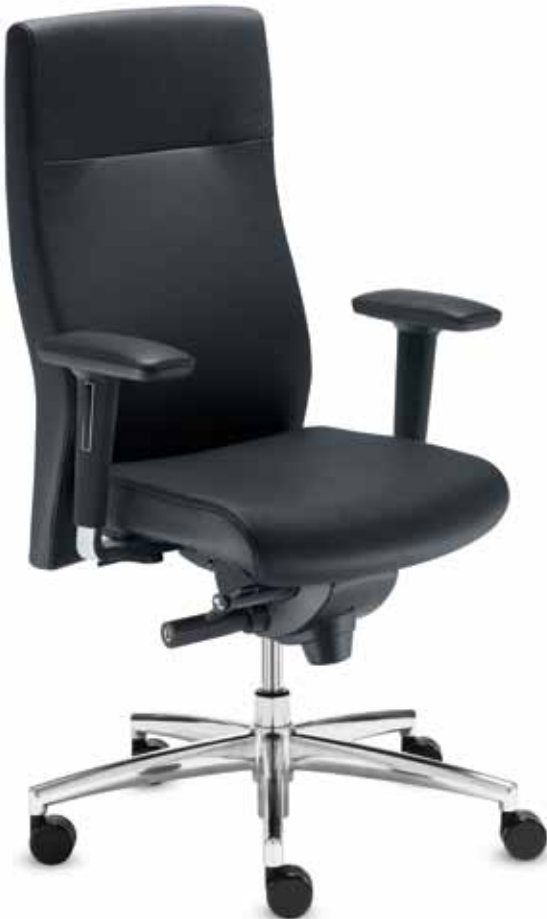
BS+ SM 96165 + Armlehnen/Armrests 173

Chefdrehessel in Leder mit multifunktionalen Armlehnen mit Leder-Armauflagen. Die Rückenlehne mit integrierter Kopf- und Nackenstütze ( 70 cm ) ist bequem im Sitzen mittels Easy-Touch-System höhenverstellbar.