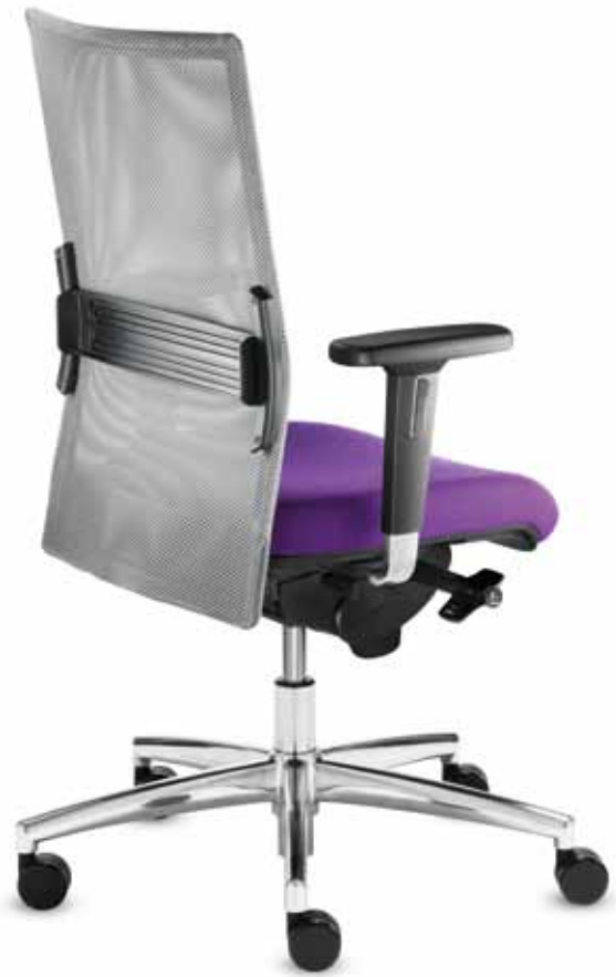
BS+ SM 96725 + Armlehnen/Armrests 172

BS SM 96620 Drehstuhl mit Ballpoint-Synchron®-Mechanik. Swivel chair with Ballpoint-Synchron® mechanism.