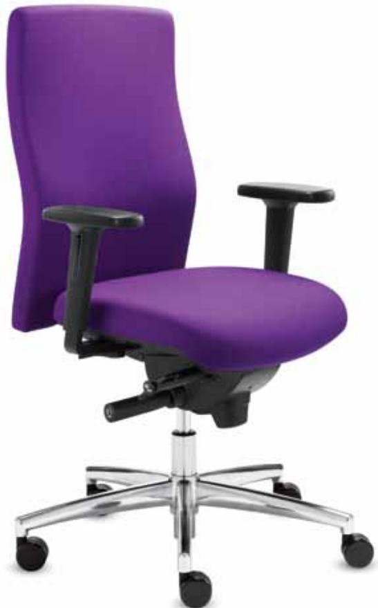
BS+ SM 96135 synchron + Armlehnen/Armrests 171

Swivel chair with fully-upholstered medium-high, height-adjustable backrest (51 cm) , changeable comfort seat and Daumatic® mechanism for automatic bodyweight adjustment.