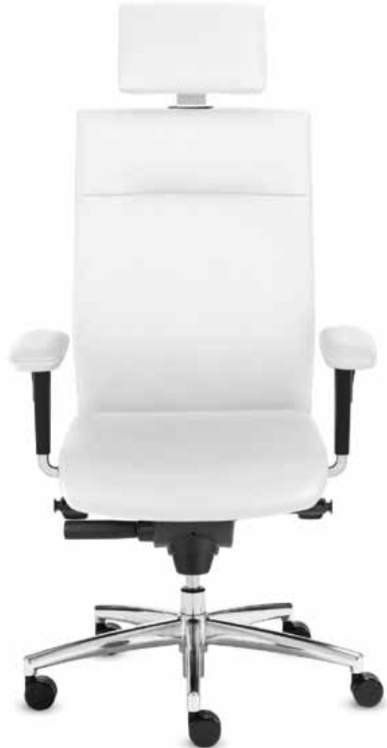
BS+ SM 96195 + Armlehnen/Armrests 173

Executive swivel chair in leather with multi-functional armrests with leather armpads. The height of the backrest with the integrated head and neckrest ( 70 cm ) can easily be adjusted while sitting using the Easy-Touch-System.