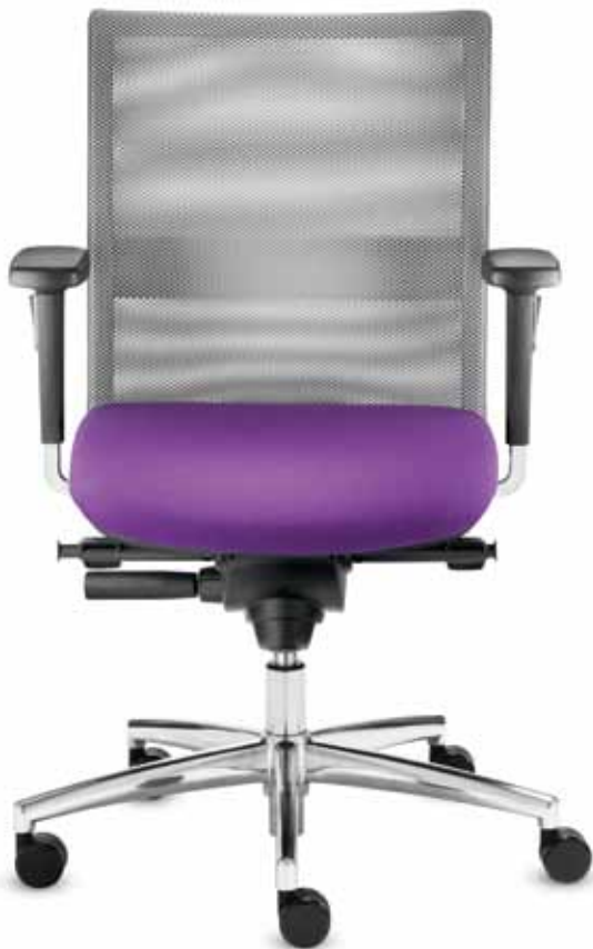
BS+ SM 96625 + Armlehnen/Armrests 172

Drehstuhl mit mittelhoher Netz-Rückenlehne (50 cm) und wechselbarem Sitzpolster. Die multifunktionalen Armlehnen mit soften PU-Auflagen sind 10 cm höhen- und werkzeuglos je 2,5 cm breitenverstellbar, 4 cm tiefenverstellbar sowie um 30° schwenkbar.