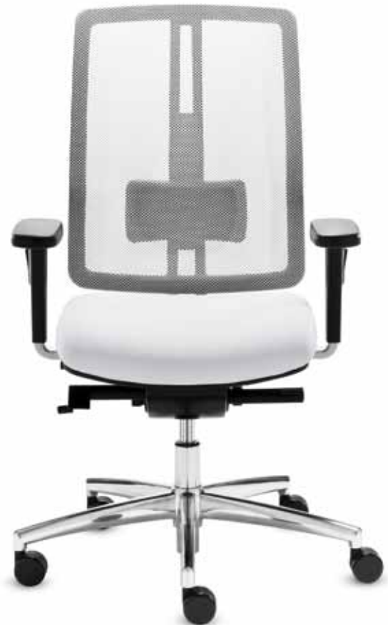
DS DA 80405 + Armlehnen/Armrests 172

Swivel chair with comfort seat and high mesh backrest (58 cm) with neckrest. The Delta-Synchron-plus mechanism allows relaxed sitting with an opening angle up to 128°. Multi-functional armrests with soft PU armpads.