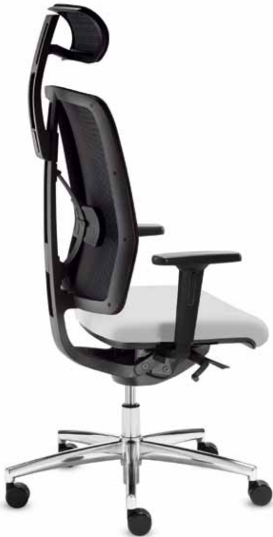
DS+ DA 80515 + Armlehnen/Armrests 171

Drehstuhl mit Komfortsitz und hoher Netz-Rückenlehne (58 cm) mit Nackenstütze. Die Delta-Synchron-plus-Mechanik ermöglicht entspanntes Relaxen mit einem Öffnungswinkel bis zu 128°. Multifunktionale Armlehnen mit soften PU-Auflagen.