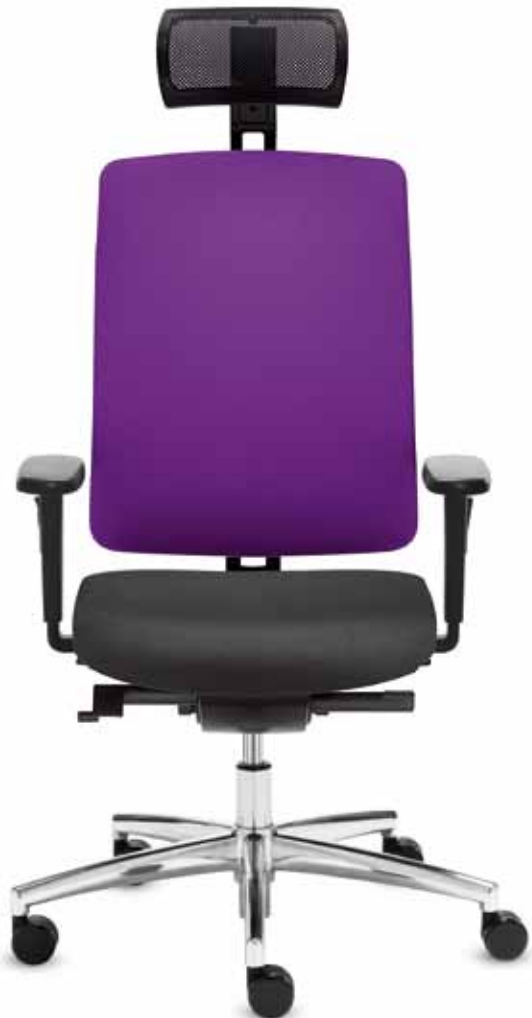
DS+ DA 80715 + Armlehnen/Armrests 171

Drehstuhl mit Komfortsitz und Netz-Rückenlehne mit Polsterauflage (58 cm) . Delta-Synchron-plus-Mechanik mit Sitzneige- und Sitztiefeverstellung. Die netzbezogene, höhenverstellbare Nackenstütze lässt den Be-Sitzer optimal entspannen.