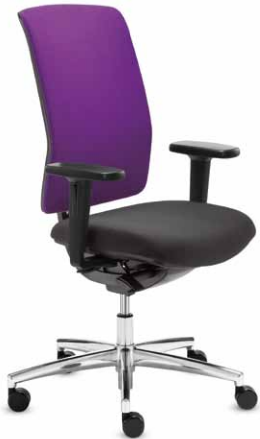
DS+ DA 80615 + Armlehnen/Armrests 155

Swivel chair with comfort seat and mesh backrest with upholstered cushion (58 cm) . Delta-Synchron-plus mechanism with seat-tilt and seat-depth adjustment. The height-adjustable mesh backrest offers maximum comfort for relaxed sitting.