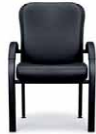
O 450 Besucherstuhl