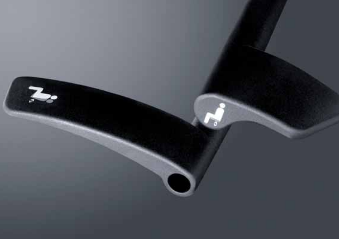
Einfache Einstellbarkeit auf das Körpergewicht, großes Gewichtsspektrum von 45 Kg – 130 Kg