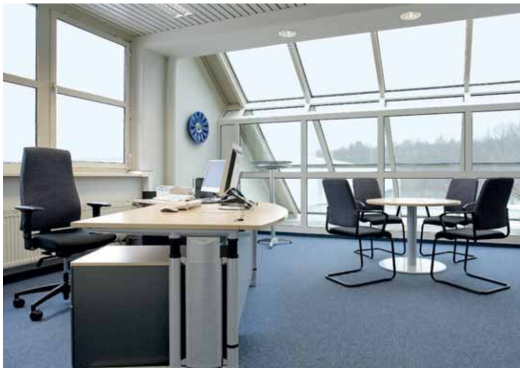
Goal, AUDI BKK, Neckarsulm