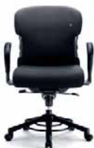
O 652 Rückenlehnenhöhe 56 cm

Auf alle Modelle des XXXL gewährt Interstuhl eine Langzeitgarantie von fünf und eine Vollgarantie von drei Jahren.