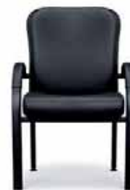
O 450 Besucherstuhl