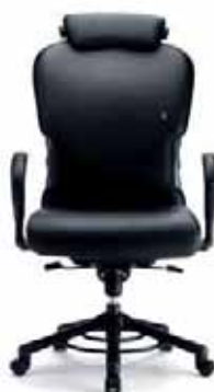
O 665 Rückenlehnenhöhe 78 cm