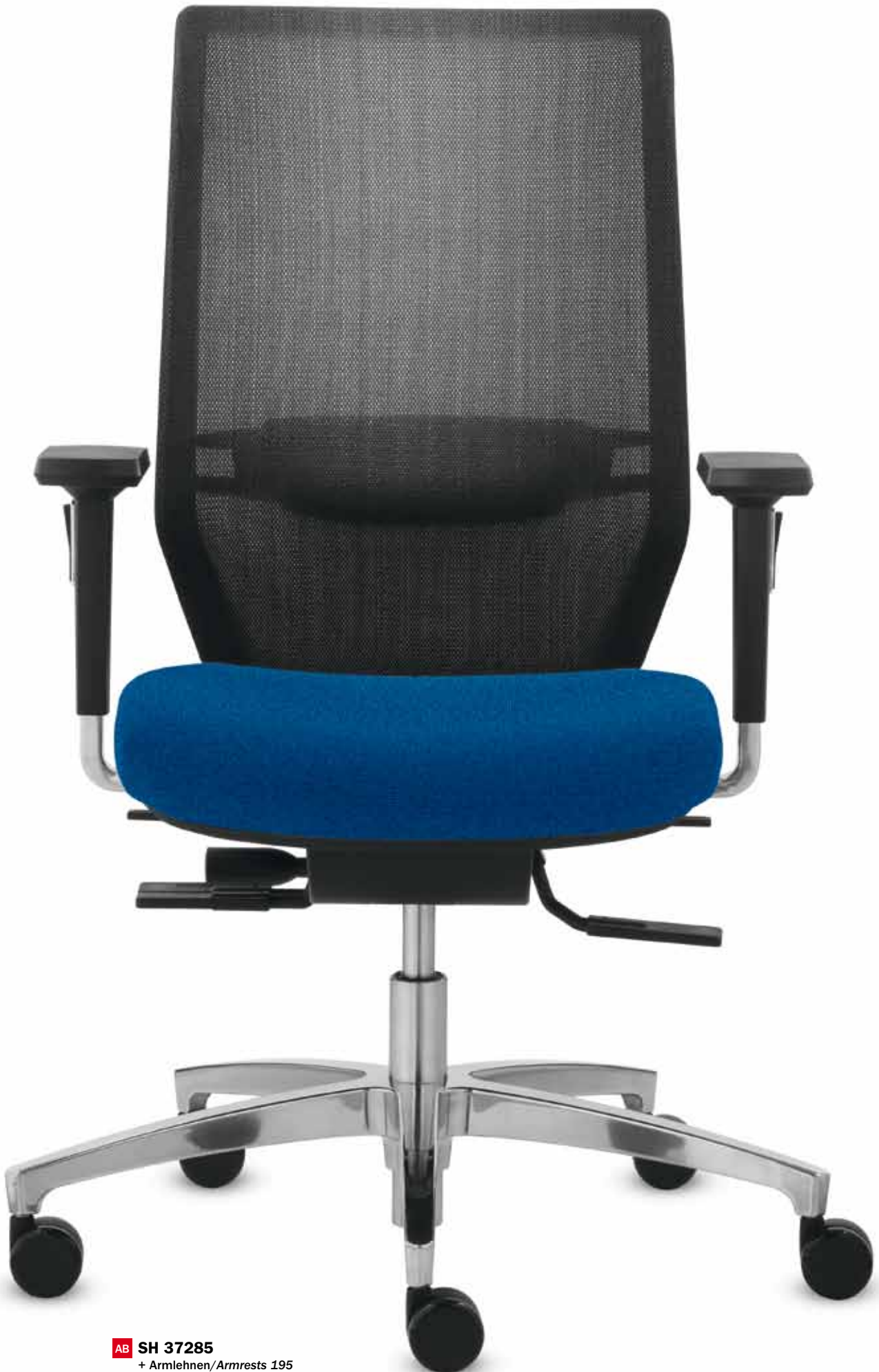
AB SH 37285 + Armlehnen/Armrests 195