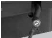
Sitzneigeverstellung dreistufig (3°/6°/0°), optional für Syncro®- Tension ( Code 10 )

Seat-depth adjustment using sliding seat (6 cm), can be locked in 6 positions (Model number SH xxxx5 )