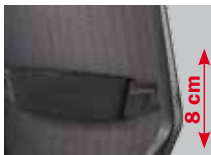
Höhenverstellbare Lumbalstütze (8 cm), gepolstert mit schwarzem Bezugsstoff ( Code 06 )

Three-position seat-tilt adjustment (-3°/6°/0°), optionally for Syncro®-Tension ( code 10 )