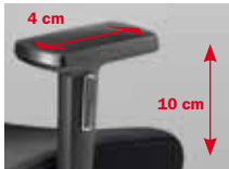
Armlehnen Nr. 125* 3F, PU-Auflagen

Armrests No. 122 2F, PP armpads (No. 123: PU armpads)