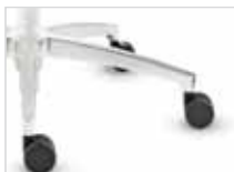
Fußkreuz Typ H Aluminium silber pulverbe- schichtet (~RAL 9006, Option)

Base type H Aluminium, silver powder- coated (~RAL 9006, option)