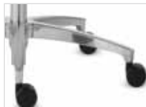
Fußkreuz Typ H Aluminium poliert (Option)

Base type H Aluminium, silver powder- coated (~RAL 9006, option)