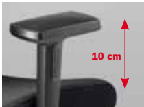
Armlehnen Nr. 122 2F, PP-Auflagen (Nr. 123: PU-Auflagen)

Armrests No. 122 2F, PP armpads (No. 123: PU armpads)