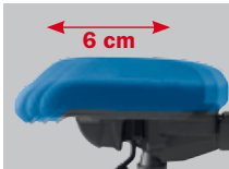
Sitztiefenverstellung mittels Schiebesitz (6 cm), 6fach arretierbar (Modell- nummer SH xxxx5 )

Seat-depth adjustment using sliding seat (6 cm), can be locked in 6 positions (Model number SH xxxx5 )