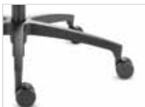
Fußkreuz Typ H Kunststoff schwarz (Standard)