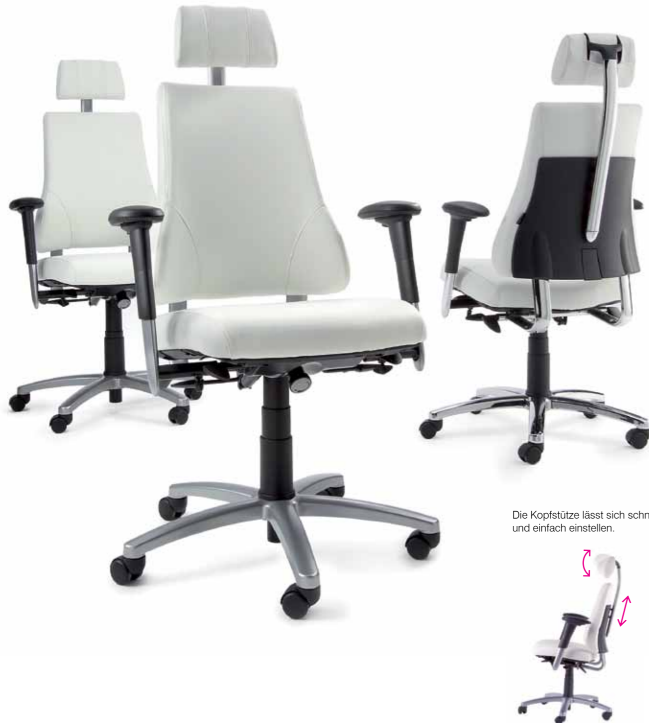
Die Kopfstütze lässt sich schnell und einfach einstellen.

Axia Plus , der EDV-Stuhl für die intensive Nutzung und komplexe Sitzwünsche.